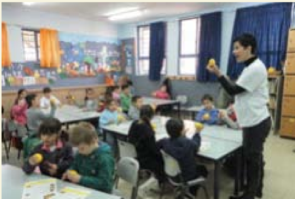
פעילות הפנתית לילדי הדרום

AIPAC - the American Israel Public Affairs Committee American Jewish Committee Greenberg Traurig, P.A FIDF Jewish Federation of Metropolitan Chicago Lions of Judah